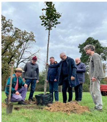
Členové spolku zasadili památný strom ve Valticích.

Nabitý víkend Česko-lichtenštejnské společnosti vyvrcholil zasaděním památného stromu ve Valticích