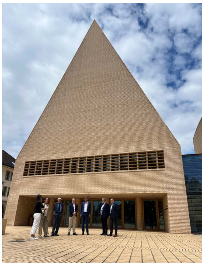
Členové spolku před moderní budovou lichtenštejnského parlamentu.

Naštěstí, v předvečer onoho deštivého závěru, čekala na členy spolku ještě společná večeře v nejstarším zájezdním hostinci v zemi, v místě s úžasnou atmosférou, hotelu Löwen. Byl to skvělý večer! Spolkový. Výřečný. Spontánní. Každý pozorovatel by si troufl říct, že všichni přítomní vůbec nemysleli na to, že jsou od domova 615, respektive 785, anebo dokonce ještě mnohem víc kilometrů. Ostatně, řada účastníků zájezdu to řekla různými