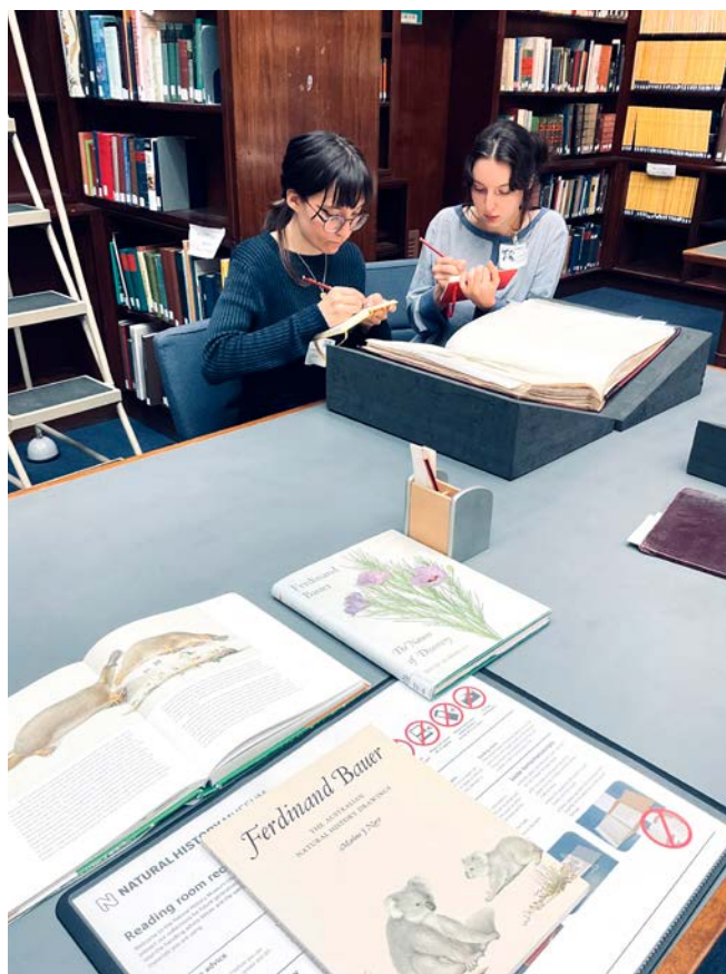
Odkaz bratrů Bauerů přivedl studentky z Jihomoravského kraje do Přírodovědeckého muzea v Londýně.