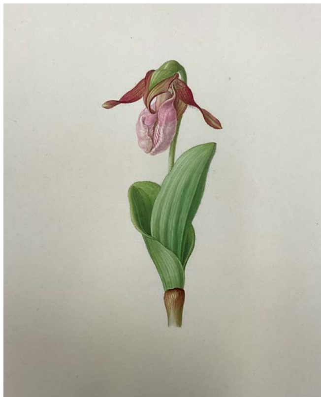
V Přírodovědeckém muzeu si studentky mohly dílo bratrů osahat a překreslit.