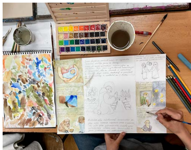
Studentky pracovaly na první české knize o bratřích Bauerových především o letních prázdninách.

Marie: No a Zdeňka oslovila nás, svoje studentky výtvarky, se kterými pracuje od malička. Každá z nás se zajímá o něco trochu jiného. Já a Nasťa jsme studovaly na Střední škole umění a designu v Brně, já motion design, tedy animaci a reklamu. Tak mě napadlo, protože jsem k tomu měla blízko, že by knížka mohla