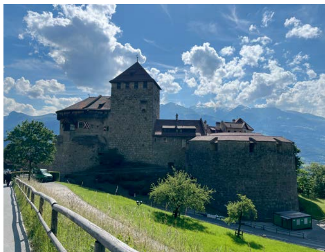
Výlet zahájila návštěva hradu Vaduz, kde členy spolku přijala Jeho Jasnost dědičný princ Alois.