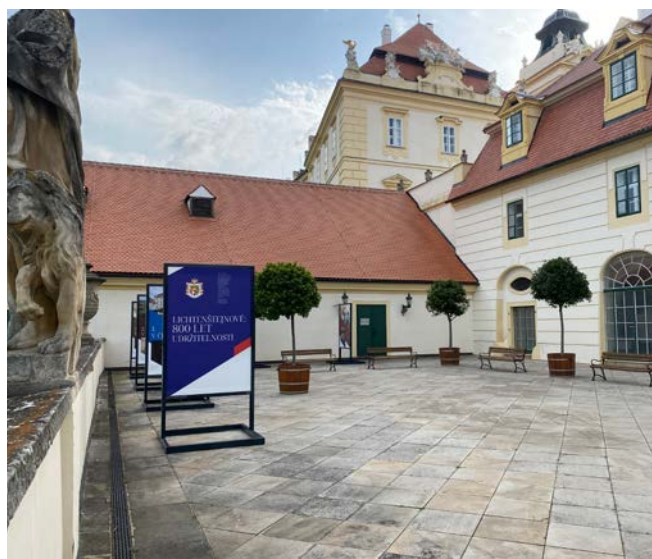
Během léta se putovní výstava zastavila například ve Valticích.

menout, že se některé lichtenštejnovské stopy nesmazatelně zapsaly do naší historie, a dodnes nás mnohdy denně provázejí. Projekt putovní výstavy si kladl za cíl přiblížit tato fakta populární formou a oslovit občany, kteří se s těmito příběhy z minulosti ještě nesetkali.