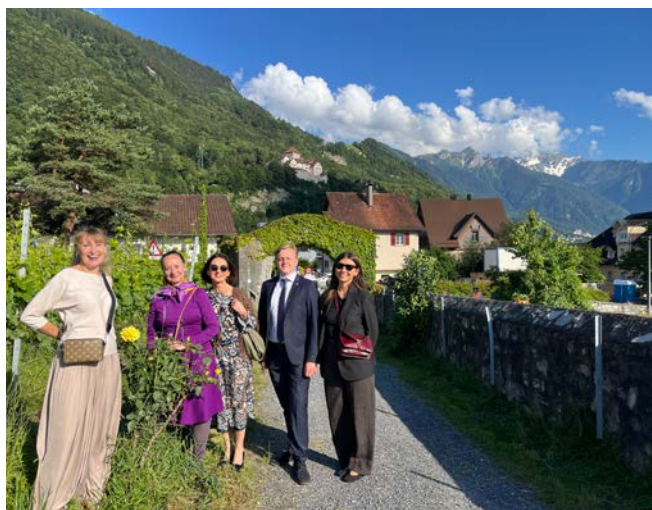
Procházka knížecími vinicemi pod vaduzským hradem.