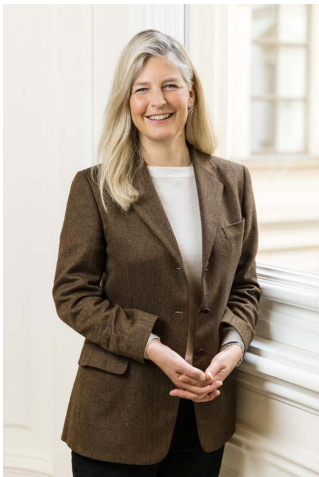
Princezna Tatjana z Lichtenštejna

„V nedávné minulosti,” doplnil princeznu Tatjanu Michal Růžička, mluvčí Nadace knížete z Lichtenštejna v České republice, “přispěl rod rychlou pomocí po ničivém tornádu obci Hrušky, která mohla z nadačních peněz zrekonstruovat zahradu své jediné mateřské školy. Lichtenštejnská vláda pak přispěla po tornádu Moravské Nové Vsi na opravu kostela a po povodních v roce 2002 poslala finance na část rekonstrukce pražského Anežského kláštera a také na vysoušení vzácných knih ve správě české Národní knihovny.” ■