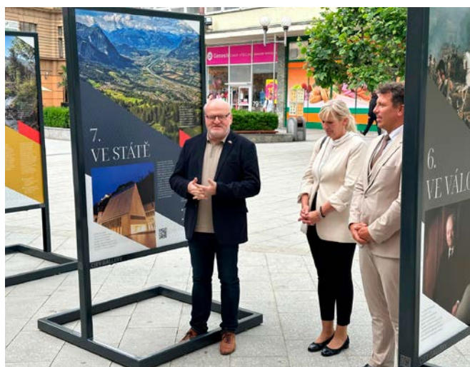
Slavnostní zahájení putovní výstavy se událo v Opavě za přítomnosti vzácných hostů a novinářů.

Lichtenštejnové jsou u nás často vnímáni pouze skrz Lednicko-valtický areál či jiné památky, ale odkaz, který tento knížecí rod v naší zemi zanechal, daleko přesahuje znalosti širší veřejnosti. Proto není nikdy na škodu připom-