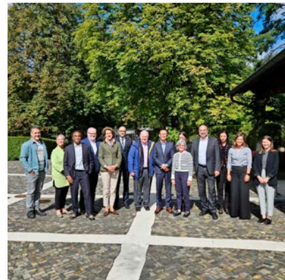
Honorární konzulové při společném setkání v knížectví.

úzce spolupracuje jak se sousedními Švýcarskem a Rakouskem, tak také s Evropskou unií. K těmto prioritám patří i podpora Ukrajiny v boji s ruskou agresí. Následovala prohlídka vybraných lichtenštejnských firem a institucí. Program uzavřel koncert studentů Lichtenštejnské hudební akademie v nově zrekonstruovaném historickém Hagen-Hausu ve městě Nendeln. ■