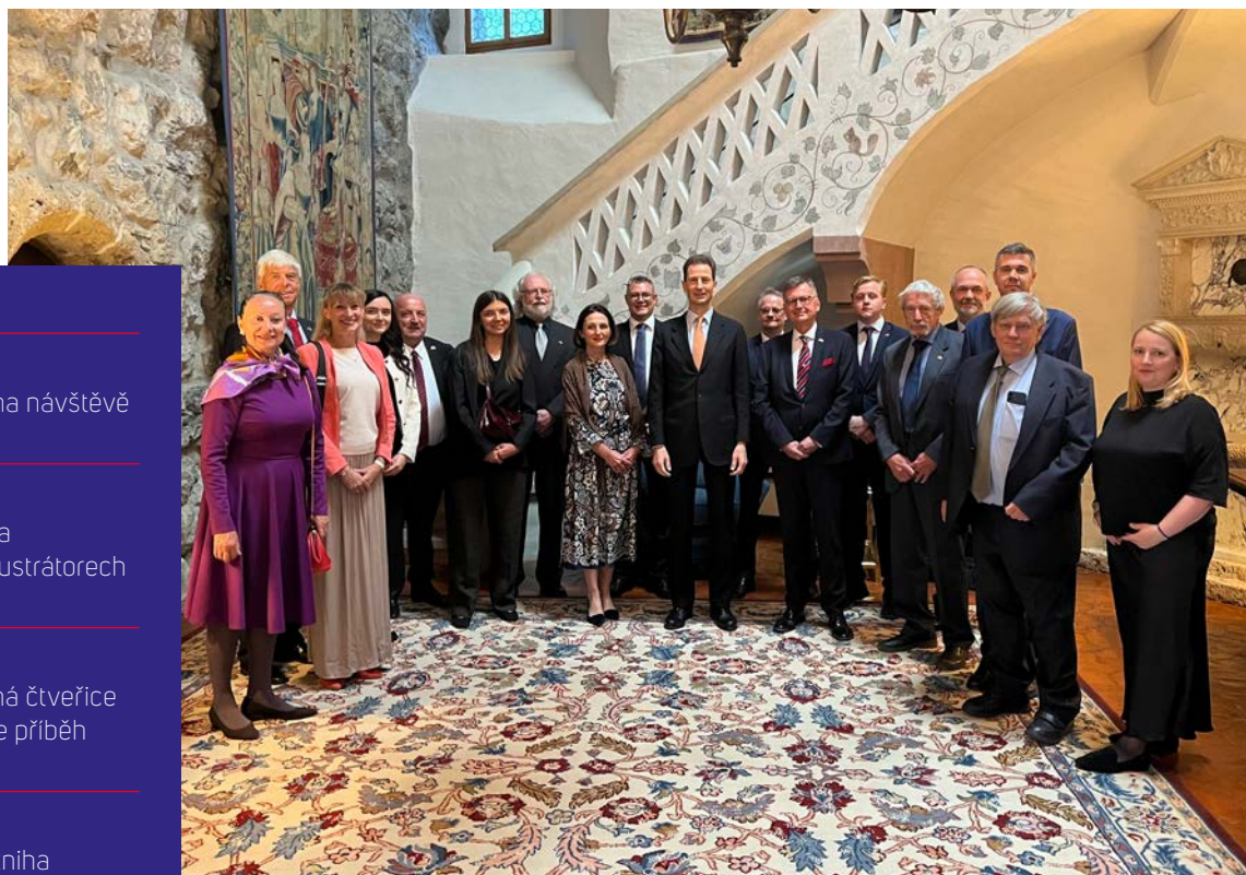
Setkání členů společnosti s Jeho Jasností dědičným princem Aloisem na hradě Vaduz.