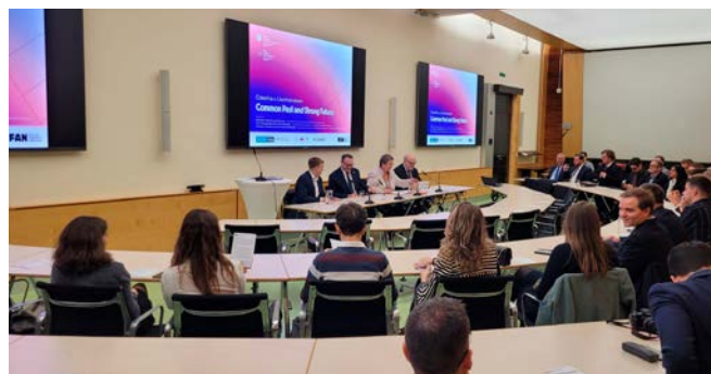
Konference ve Vídni přilákala řadu studentů z obou zemí.